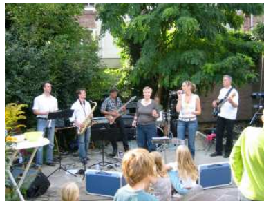
GiGi & Dance