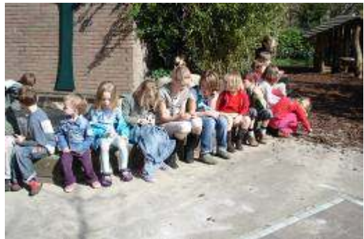
Volgend jaar weer???