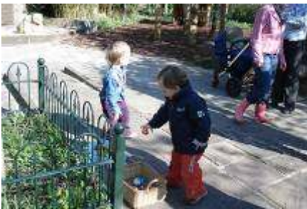
Alles terug in de mand, en alles eerlijk delen.