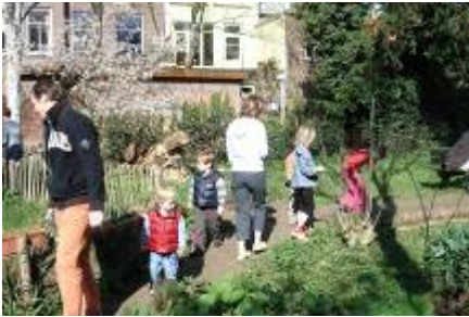
25 kinderen gaan op zoek